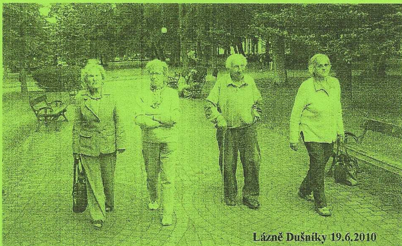
Lázně Dušníky 19.6.2010