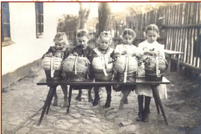
Krajkářství ve Vamberku na počátku 20. století