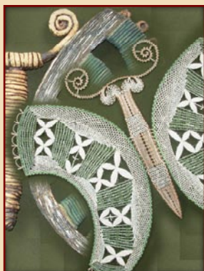
Tvorba Krajkářské školy Vamberk