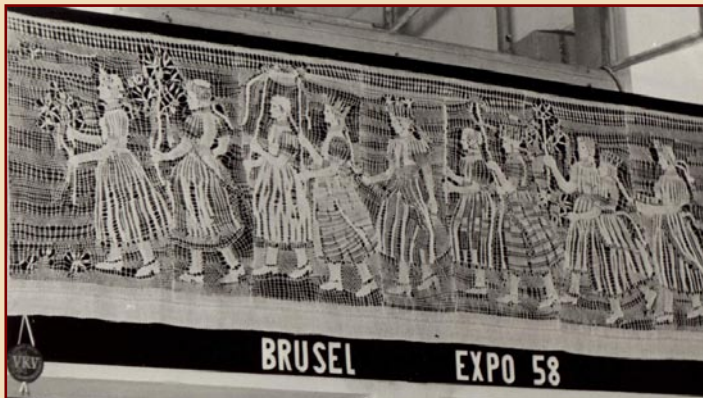
Výrobek Vamberecké krajky Vamberk (VKV) na EXPO 58 v Bruselu