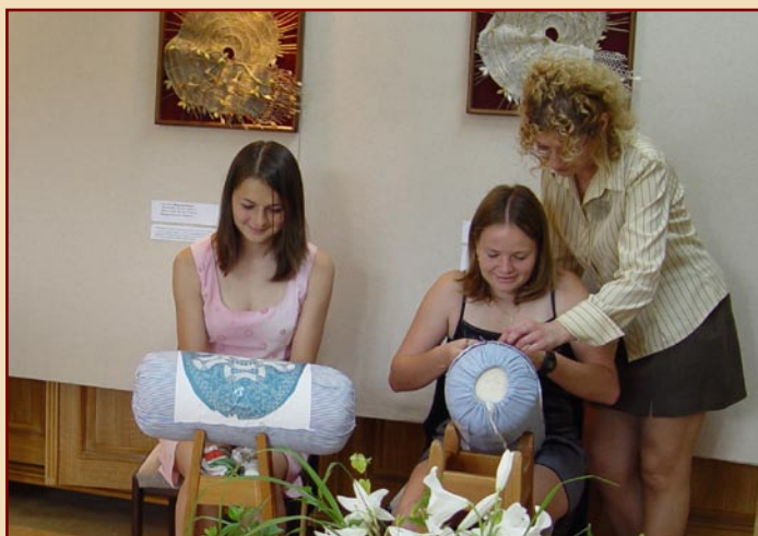
Krajkářská škola Vamberk

Muzeum krajky Vamberk je specializovanou institucí s celostátní působností. Sbírkový fond, jehož počátky souvisí s otevřením krajkářské školy ve Vamberku v roce 1889, obsahuje krajky především paličkované, ale zastoupeny jsou i krajky hotovené jinými technologiemi. Vedle stálé expozice nabízí Muzeum krajky každoročně také výstavy tématické, věnované krajkám historickým