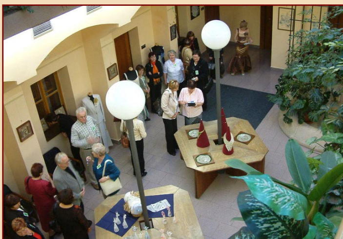
Krajkářská škola v Poslanecké sněmovně Parlamentu ČR s výstavou ručně paličkované krajky, r. 2008